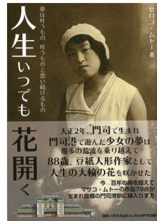
マサコ・ムトー伝記 「人生いつでも花開く」