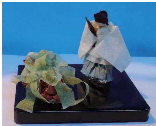
「戦時中の風景と懐かしい思い出」より 『門司・めかり神社の神事』