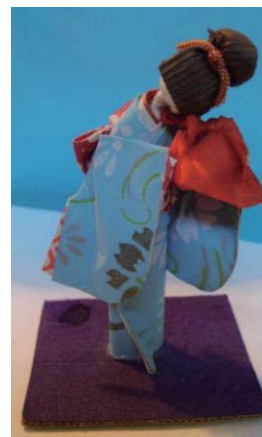
「子どもの遊びや懐かしい風景」より 『踊りの稽古』