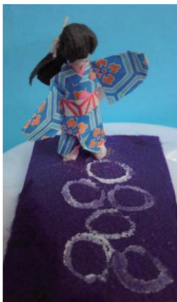
「子どもの遊びや 懐かしい風景」より 『けんば』